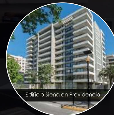
Edificio Siena en Providencia